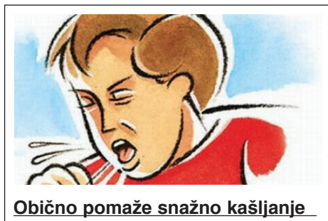
Obično pomaže snažno kašljanje

Ako osoba ima simptome teže opstrukcije dišnog puta a pri svijesti je: